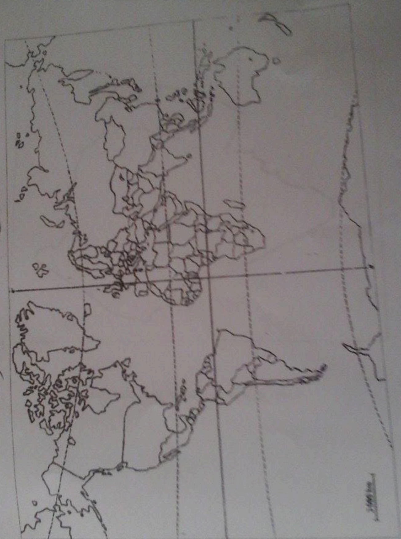
شجر العسل على الخريطة وعدد مع أوراق الإجابة