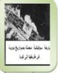
بداية سباق التسلح النووي في أوروبا الشرقية