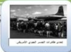
إعداد طائرات النصر الجوي الأمريكي