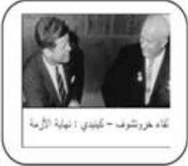
لقاء خروتشوف - كينيدي : نهاية الأزمة